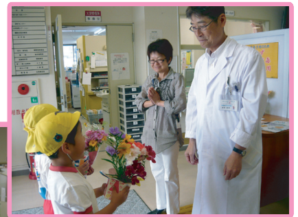
6月15日 あいりんほいくえんの おともだち