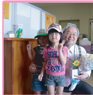
6月2日 いまづようちえんの おともだち