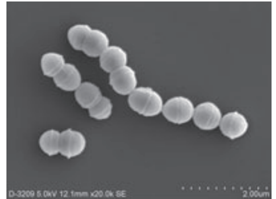
A群溶血性連鎖球菌 電子顕微鏡写真

潜伏期は2～5日ですが、潜伏期での感染性については明らかになっていません。発症する場合は突然の発熱と全身倦怠感、咽頭痛によって発症し、しばしば嘔吐を伴います。咽頭壁は浮腫状で扁桃には浸出液を伴っています。軟口蓋に点状出血がみられることがあり、更には特徴的な莓舌が認められる場合があります。発熱開始後12～24時間すると点状紅斑様、日焼け様の皮疹が出現して猩紅熱と呼ばれる病態を呈することがあります。針頭大の皮疹により、皮膚が紙やスリ様の手触りとなる事が特徴的です。この場合、通常顔面には皮疹はなく、額と頬が紅潮し、口の周りのみ蒼白にみえると言われています。このような症状が出た場合は、感染を食い止めるためにも早めに医療機関に受診してください。