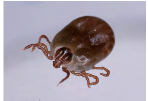
フタトゲチマダニ