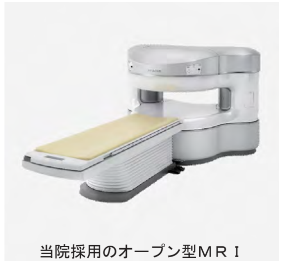
当院採用のオープン型MRI 日立製作所 AIRIS Vento

化粧品には、金属成分を化合しきれいな色を出している場合が多くあります。この金属が磁場に影響し、火傷を起こす場合があります。薄めの化粧品にして来院するか、担当技師の指示に従い、化粧を落として頂く場合があります。事故防止のため御理解・御協力をお願い致します。