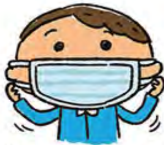
ゴムひもを耳にかける