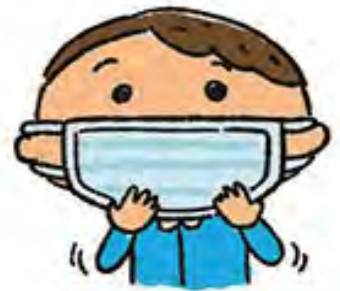
隙間がないよう 鼻まで覆う

また、外出時に使用したマスクにはウィルスが付着している恐れがありますので、建物や部屋など密室に入る前にゴミ箱に捨てるようにしましょう。マスクを密室内に放置するとそこから感染する可能性もあります。