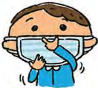
鼻と口の両方を 確実に覆う

少しでもマスクの予防効果を高めるために、隙間のないように着用することが大切です。鼻の頭とあごがマスクですっぽりと覆うように意識してみてください。一般的なサージカルマスクには鼻に当たる部分に、金属や硬い紙でできた薄い棒状の物が入っていますので、これを顔の形に変形させることでマスク上部の隙間をなくします。人間の鼻の穴は下を向いていますから、あごの部分に隙間があると、地面から舞い上がったウィルスを直接吸い込むこととなりますのであごもしっかり覆ってください。