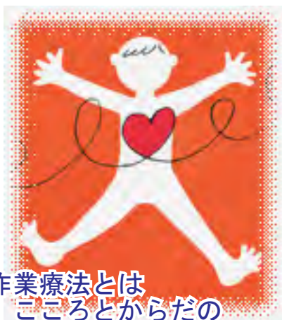
作業療法とは こころとからだの リハビリテーション